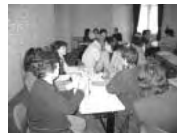
←参加者が活発に意見交換するグループワーク