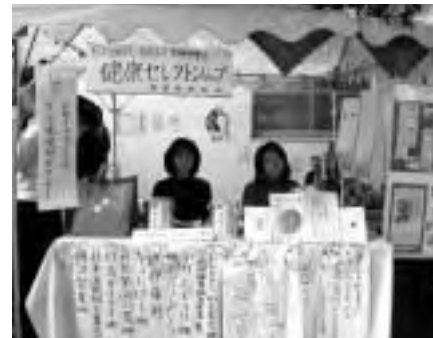
福袋の配布やブックレット販売では、学生ボランティアも大活躍。

ポリフェノール、カテキン、中鎖脂肪酸などを含む生活習慣病予防効果がある健康食品を詰めた「福袋」100セットを来場者に配布しました。とくに若い女性や子供連れの主婦の方に好評でした。また、お茶の水女子大学に関心をもつ受験生とご家族の方なども足を止め、熱心に説明に耳を傾けてくださいました。おかげさまで、「お茶の水ブックレット」(No.1「教育と平和」アフガニスタン女子教育支援シンポジウムより/No.2「国立大学改革とお茶の水女子大学のゆくえ」)を計120冊販売でき、よい広報活動となりました。