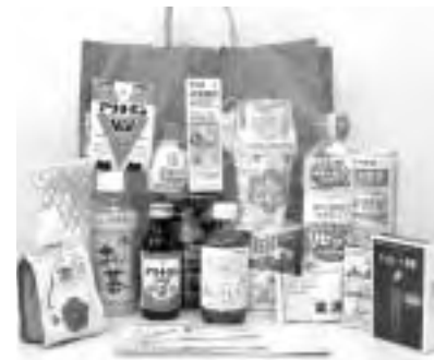
福袋の中身はご覧のとおり話題の健康食品がぎっしり!