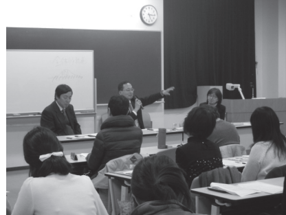
お茶大保育フォーラム 会場

育及び保育の認定こども園での位置づけ、保育所・幼稚園にとっての新制度の意義等について解説をしてくださりました。新制度は、まずは待機児童問題解消のためにあるが、単に受け皿を増やすということではなく、保育者研修、施設・設備の充実など保育の「質」の向上と一体で進められることを強調され、そのために必要なことをご自身の“願い”も交えつつ話してくださいました。