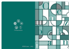
● A4 サイズ：1枚 120円 (本体価格)

お茶の水女子大学の特徴の一つとして、同じ敷地内に附属幼稚園、小学校、中学校、高等学校、大学があることが挙げられます。そこで、大学ならびに各学校園にご協力いただき、5校園の校章入りクリアファイルを作成しました。反対面は、国の登録有形文化財建造物に指定されている大学本館や附属幼稚園園舎にあるステンドグラスのイメージに、「Ochanomizu」の文字を散らしたデザインです。大学生協、お茶の水学術事業会で販売しています。イベントの記念品や同窓会のお土産としてもぜひご利用ください。