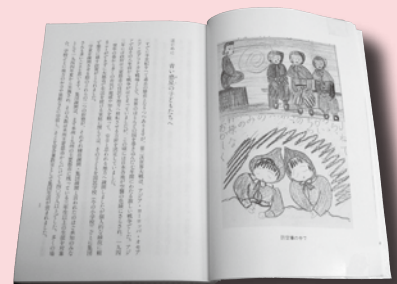
▲『疎開の子ども600日の記録』には、のべ160日分の絵日記が収録されている

( http://www.h5.dion.ne.jp/~s600days ) も是非ご覧ください。