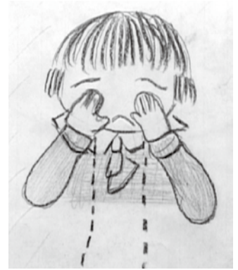
▲ 6 年女子「始メハ悲シカツタワ」

お茶の水女子大学附属小学校の卒業生グループ「平和祈念プロジェクト 21」が制作した DVD とスライド『絵日記による学童疎開 600 日の記録』が、『文部科学省選定および特別選定』、『日本視聴覚教育協会第 56 回優秀映像教材選奨 社会教育部門 優秀作品賞』、『第 36 回自作視聴覚教材コンクール 社会教育部門 優秀作品賞』の三冠に輝きました。