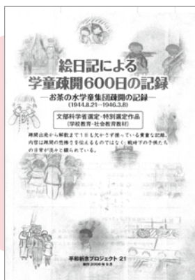
▲ DVD は、写真資料と 68 日分の絵日記を収録し、疎開について分かりやすくまとめられている

集まった資料はカラーコピーをし、1989 年に『第二次世界大戦学童疎開記録集』（全 11 巻、A3 判・約 3500 枚）として、国立国会図書館・お茶の水女子大学附属図書館に納入し、