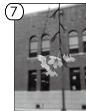
大学本館中庭にて