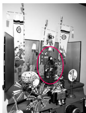
▲神武天皇を中心とした中央上段の飾りつけ