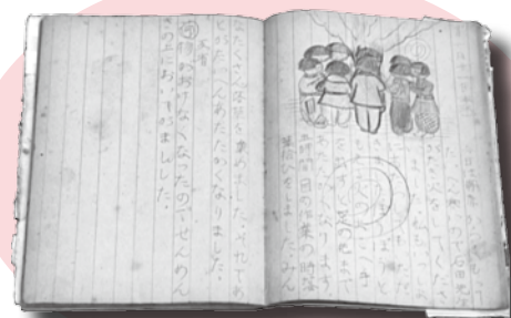
▲ 昭和 21 年 1 月 11 日 3 年女子一冬になっても 1 日中戸外で過し、焚き火・押しくらまんじゅう・駆け足などをして寒さをしのいだ。