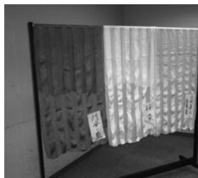
▲ 草木染めの布 (作：谷萩礼子氏)

けれども、平安時代には、当たり前ですが、今のような工場はありません。『夕鶴』という有名な劇にも機織 はたおり が出てきますが、平安時代はもちろん、近代のある時期まではずっと女の人が機を織っていました。絹糸をよって(木綿は中世以降)、草木の汁などで染めて、織って反物にして、それを今度は、裁って縫 ぬい います。これは家の女主人が女房、女童 めわらわ と一緒に全部邸でやりました。ですから、織るときの模様にしても、糸や布を染める色にしても、現代