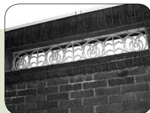
▲ うさぎとかめをデザインしたグリル