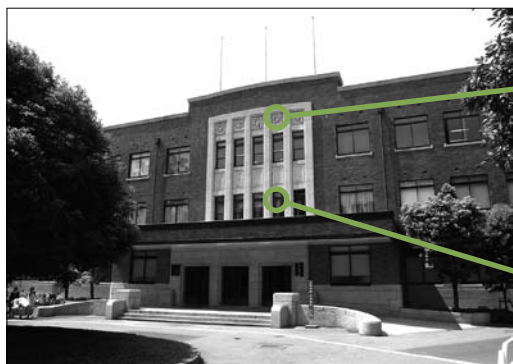
▲ 正面玄関の上（2階）が貴賓室（現大会議室）