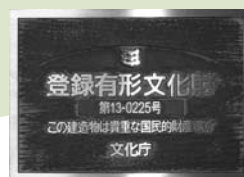
▲ 登録有形文化財プレート（幼稚園）