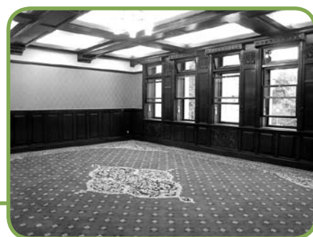
▲ 貴賓室のペルシャ絨毯・壁紙は、平成18年の改修工事の際に建設当初の色、柄に復元された