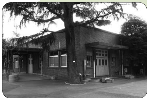
▲ 園舎の外観一玄関前のヒマラヤスギは竣工時に植えられたもの