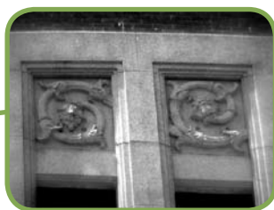
▲ ぶどうの房と茎のレリーフ