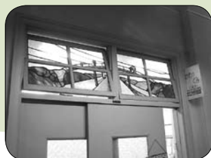
▲ 「かわのくみ」のステンドグラス